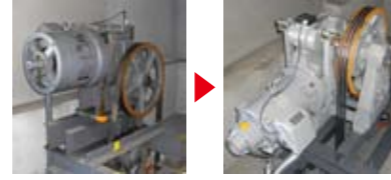
巻上機一式取替 電動効率の良い最新式の巻上機でモーターも コンパクトになります。

💡 イメージアップ かご内、乗場にデジタルインジケータを採用し、 より見やすく近代的なイメージに。 押しボタンも押しやすい大型ボタンを採用しています。