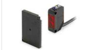
かごドアセンサー センサーでドアへの挟まれを防止します。荷物の横込みなど安心して行えます。