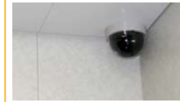
防犯カメラ かご内に防犯カメラを設置できます。 乗場にモニターを追加することも可能です。