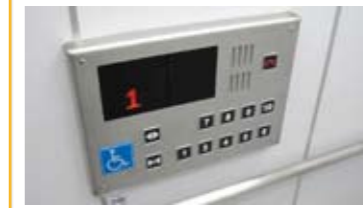
副操作盤 かご内側面に操作盤を追加できます。 車いすでの利用が大変便利になります。