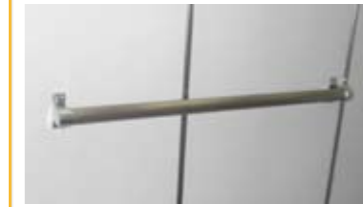
かご内手すり かご内に手すりを設置できます。 お年寄りにも安心です。