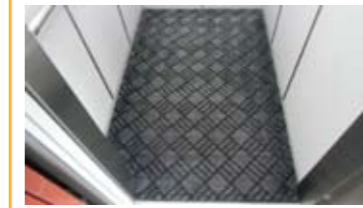
床マット エレベーターの床を清潔に保ちます。 さまざまな種類からお選びいただけます。