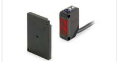
かごドアセンサー センサーでドアへの挟まれを防止します。 荷物の横込みなど安心して行えます。