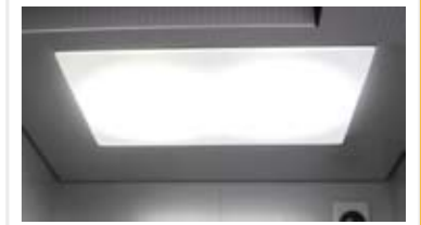
LED照明 既存の照明器具をLEDに置換えます。 省エネに貢献します。