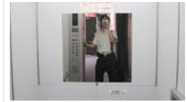
かがみ 車いすの乗降時に後方を確認できます。お出かけ前の身だしなみにも。