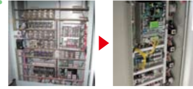
制御盤取替 適正なトルクコントロールを行うインバーター制御 方式を採用し、無駄なく省エネに貢献します。