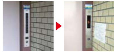
乗場用操作盤取替 文字でハッキリ表示されるため、運行状況が大変見や すくなります。また、「点検中」など文字情報も表示 されます。