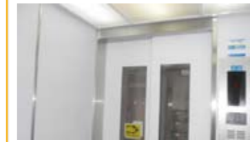
内装クロス貼り替え クロスを貼替えイメージを一新できます。 様々な種類からお選びいただけます。