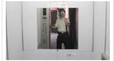
かがみ 車いすの乗降り時に後方を確認できます。 お出掛け前の身だしなみにも。