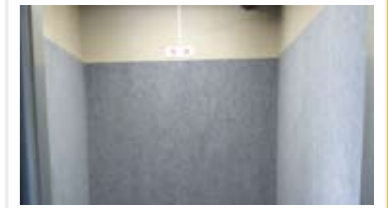
壁面保護マット 壁を傷や落書きから守ります。 色やサイズをお選びいただけます。