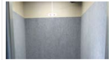
壁面保護マット 壁を傷や落書きから守ります。色やサイズをお選びいただけます。