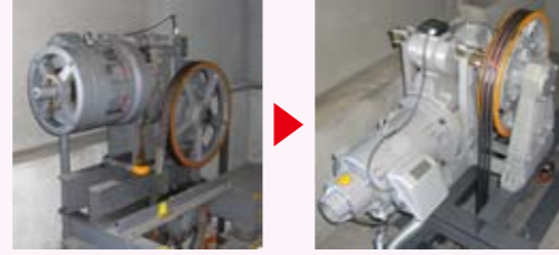
巻上機一式取替 電動効率の良い最新式の巻上機でモーターもコンパクトになります。

建物と共にエレベーターも老朽化します。設計耐用年数 25 年を超えたエレベーターでは、部品の供給停止も次々と発表されており、万が一の故障の際に長時間休止してしまうことも。三好エレベータのリニューアルは、お客様に合わせたご提案をいたします。将来を見据え、安全性・快適性・省エネに優れたエレベーターリニューアルをおすすめします。