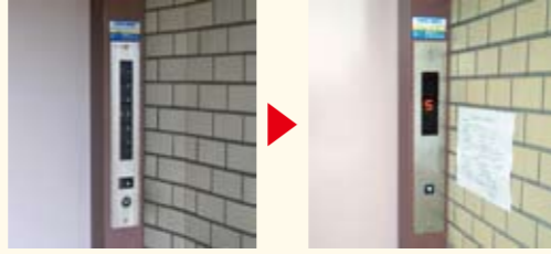
乗場用操作盤取替 文字でハッキリ表示されるため、運行状況が大変見やすくなります。また、「点検中」など文字情報も表示されます。