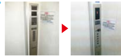
かご操作盤取替 どなたにも押しやすいユニバーサルデザインのボタン採用。 階床表示が操作盤と一体となり、デジタル表示になりました。