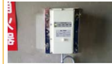
地震感知器 (S波・P波) 地震発生時に最寄り階へ自動停止します。標準オプション