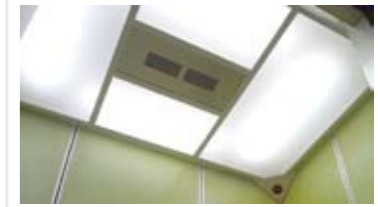
吊り天井 (LED 照明) 近代的なイメージになり、LEDで省エネ。エレベーター内がとて明るくなります。