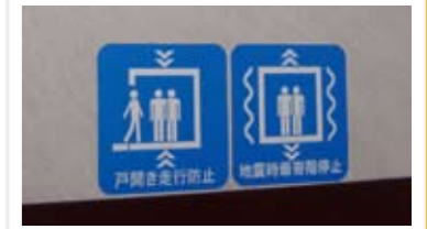
戸開走行保護装置（停電管制装置付き） 2重ブレーキで安全性を向上します。 停電時に最寄り階へ停止する機能付きです。