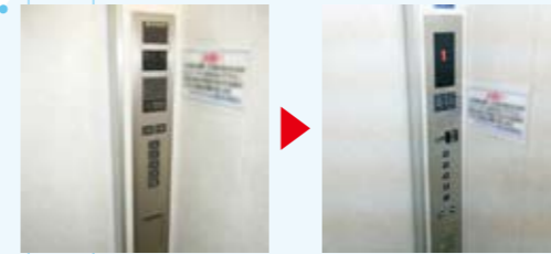
かご操作盤取替 どなたにも押しやすいユニバーサルデザインのボタン採用。階床表示が操作盤と一体となり、デジタル表示になりました。