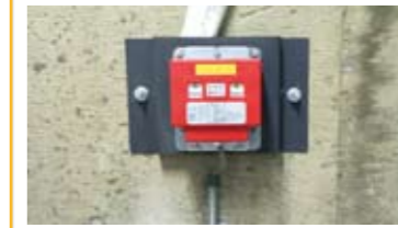
地震感知器（S波・P波） 地震発生時に最寄り階へ自動停止します。 標準オプション