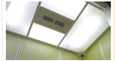
吊り天井（LED照明） 近代的なイメージになり、LEDで省エネ。 エレベーター内がとて明るくなります。